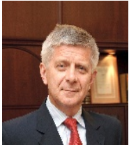
Marek Belka Former Prime Minister of Poland

GAC committee members are all first class experts in their fields, including former prime ministers, world famous entrepreneurs , and renowned scholars.