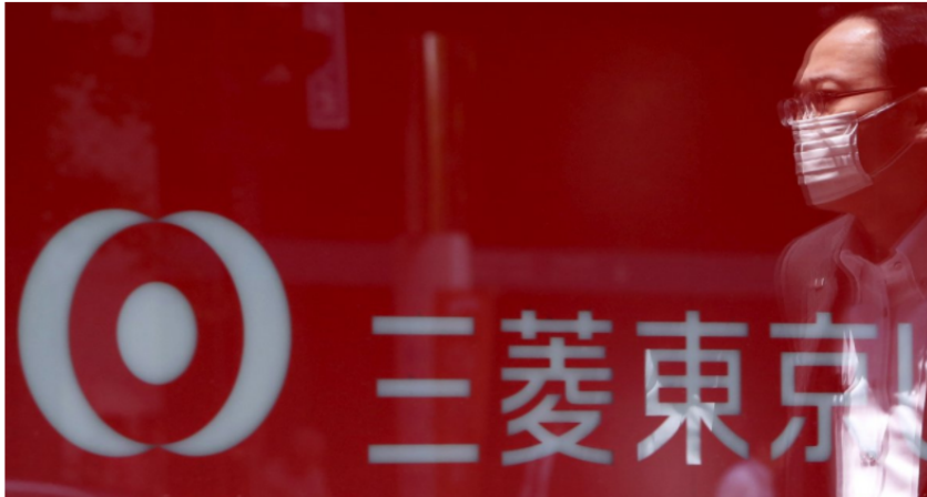
5. Mitsubishi UFJ Financial, Japan – $2.59 trillion