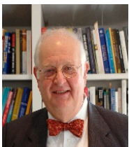
Angus Deaton 2015 Nobel Laureate for Economic Sciences