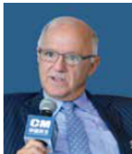
Stephen Orlins President of National Committee on United States-China Relations