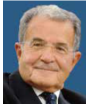
Romano Prodi Former President of the European Commission, Former Prime Minister of Italy