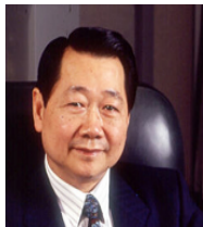
Dhanin Chearavanont Chairman And President, Charoen Pokphand Group