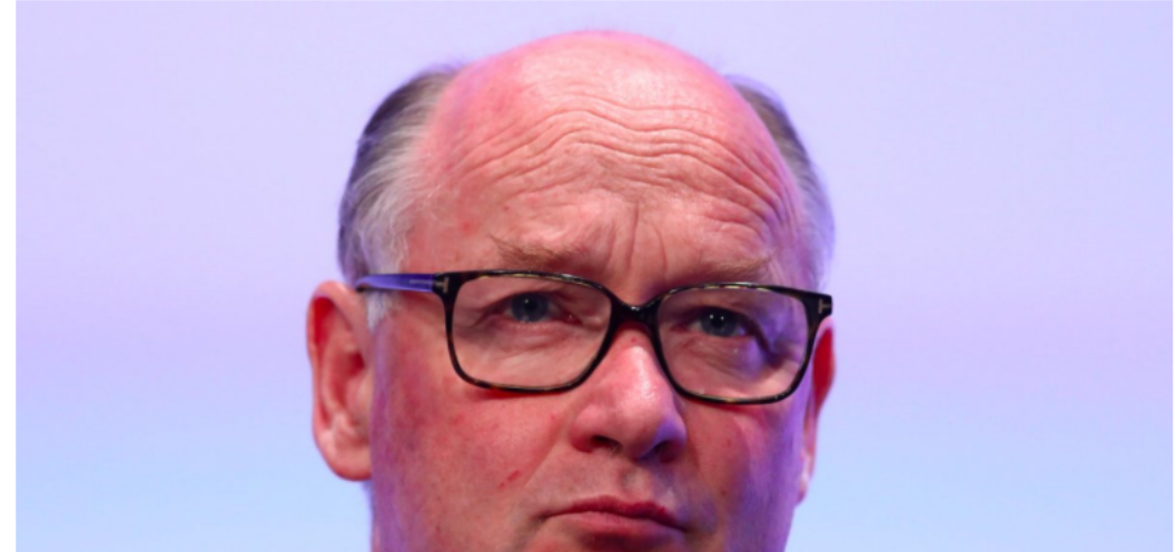
7. HSBC, UK – $2.37 trillion