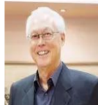
Goh Chok Tong Former Prime Minister of Singapore