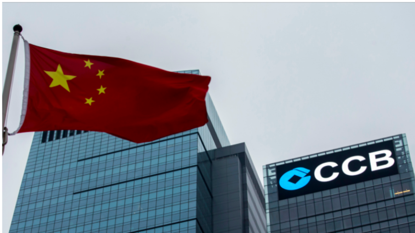
2. China Construction Bank, China – $3.02 trillion