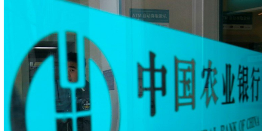
3. Agricultural Bank of China, China – $2.82 trillion