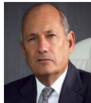
Ron Dennis Chairman & CEO, McLaren Technology group