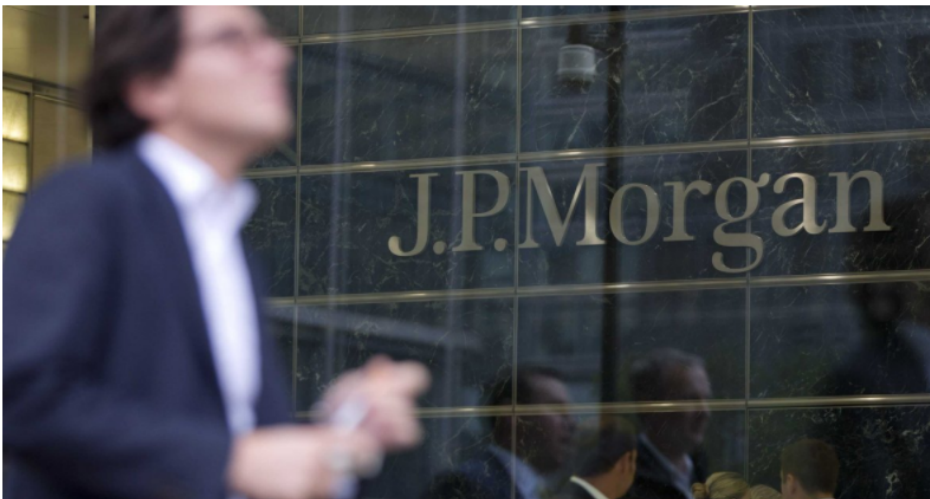
6. JPMorgan Chase, USA – $2.49 trillion