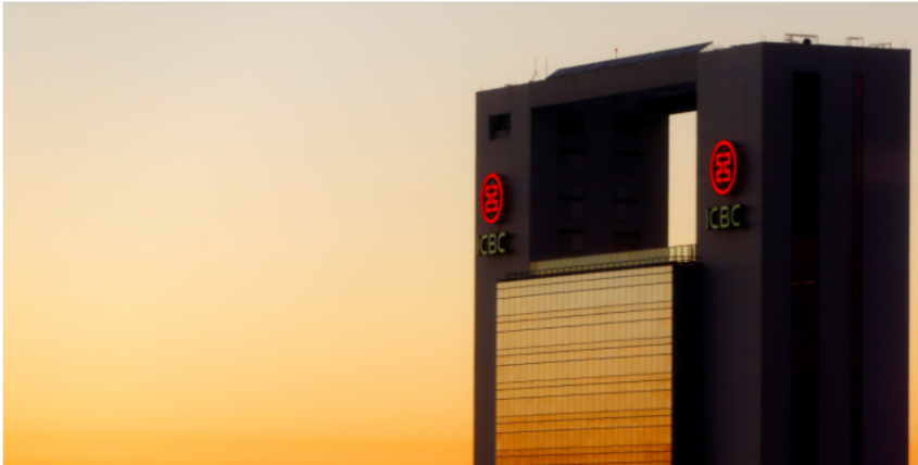
1. Industrial & Commercial Bank of China, China – $3.47 trillion