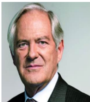
Roland Berger Founder, Roland Berger Strategy Consultants