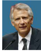
Dominique de Villepin Former Prime Minister of France